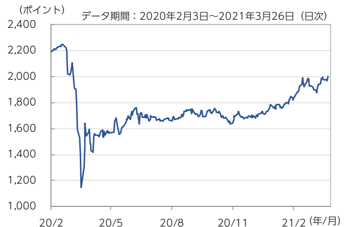
図表2：東証REIT指数とTOPIXの推移