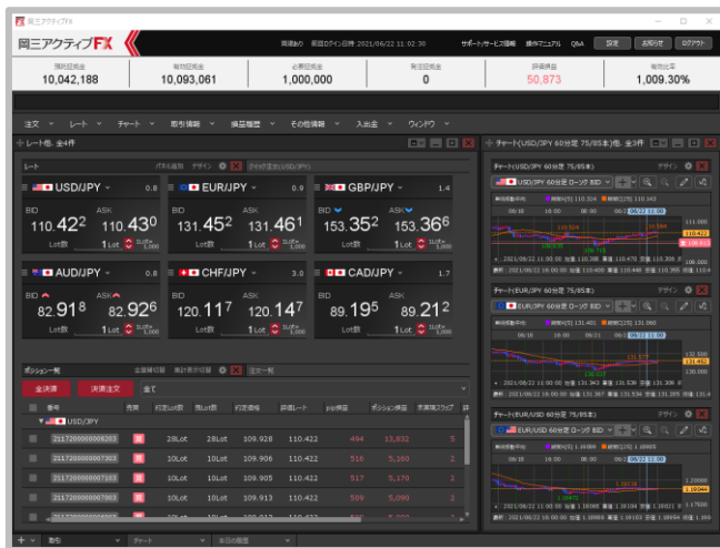
初回ログイン時に表示される画面です。