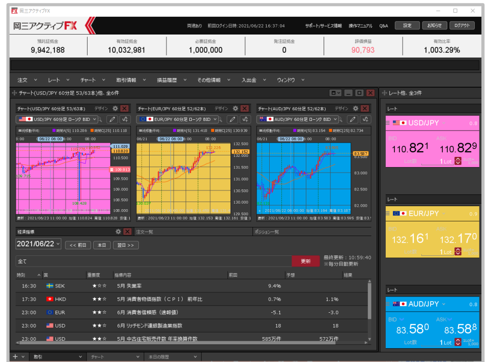
カスタマイズ後の画面

ウィンドウの並べ替えなどにより、カスタマイズした画面です。カスタマイズした画面設定は、保存することができます。