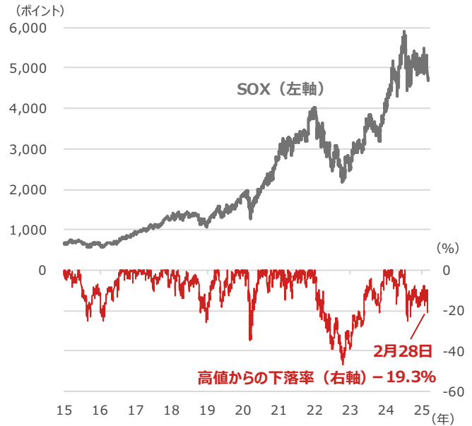
SOX（フィラデルフィア半導体株指数）と高値からの下落率

期間：2015年1月2日～2025年2月28日、日次 ・高値からの下落率は2015年1月2日を基点とした