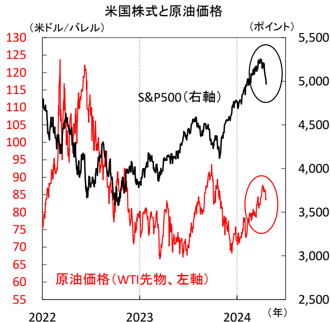
【図1】 昨年終盤からじり高基調の原油価格、今年4月から上値を重くする米国株式

米利下げ観測や地域紛争を巡る不透明感が渦巻くなか、高めのインフレや金利を、強い景気の裏返しと冷静に見られるかが株価安定の鍵といえます。スタグフレーション（景気悪化・インフレ加速）的な動きが強まらないかを含め、今後の経済指標から、底堅い景気とインフレ収束傾向が確認できるかが焦点です（図2）。（瀧澤）